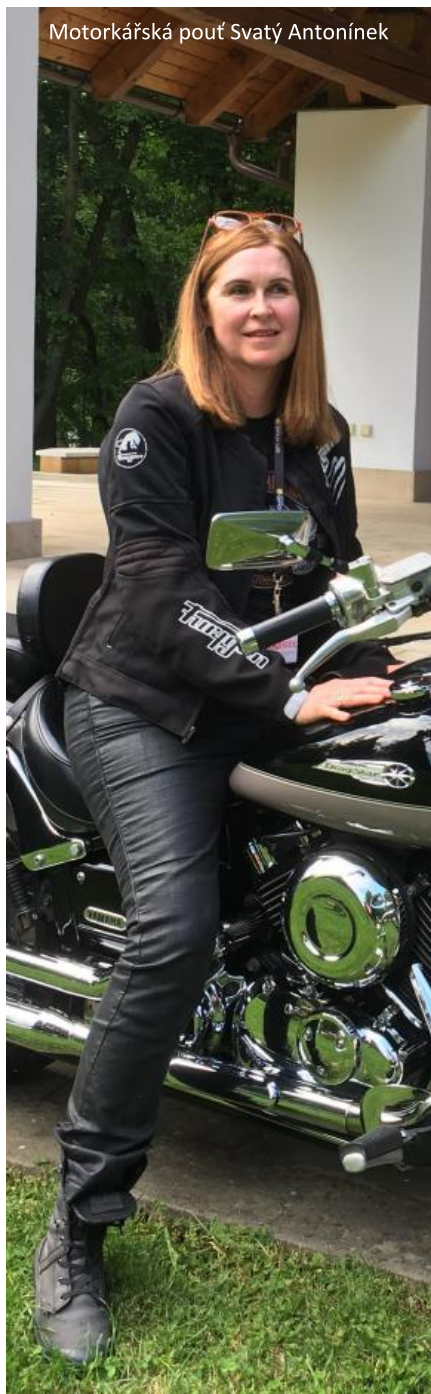
Motorkářská pouť Svatý Antoníněk

Potěšilo mě, když jsem v roce 2021 dostala milost od Pána k moto pouti z Přímětic na jižní Moravě do Jeníkova v Severních Čechách. Na pouť mě upozornila kamarádka novinářka. Vůbec nikoho jsem neznala, a přesto jsem vyrazila. Na motorce jsme jeli pouze tři: farář, varhaník a já. Souběžně s námi putovala do Jeníkova početná skupina farníků, a to na kolech. Když jsem viděla, jak se nadřeli a my tři jsme stihli v klidu po cestě různé zajímavé prohlídky, měla jsem skoro výčitky svědomí, že mám takovou pěknou pouť. Krásná byla také cesta na motorce do kláštera kapucínů v Sušici spojená s divadlem pro děti v klášterní zahradě. Kamarádka, se kterou jezdím na motorce, je loutkoherečka, tak jsou někdy naše jízdy spojeny s divadelním představením. Obě máme vnučky stejného věku a o prázdninách je bereme na motorku s sebou. Nádherné chvíle jsme s nimi prožily u přátel ve Zlatých horách. Mají pohádkový dům s pekárnou hned vedle kostela, kde jsme se všichni budili do vůně čerstvého chleba.