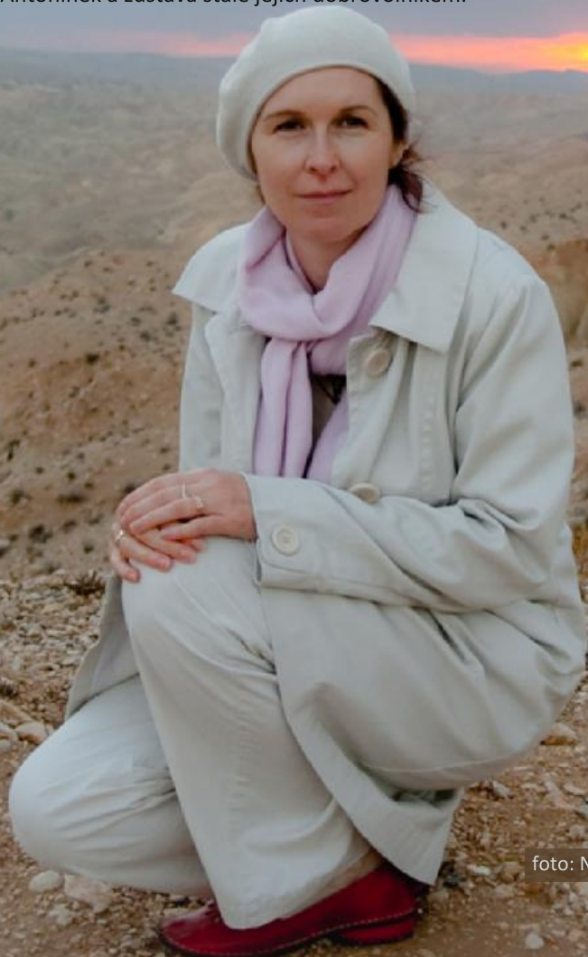
foto: Na Negevské poušti