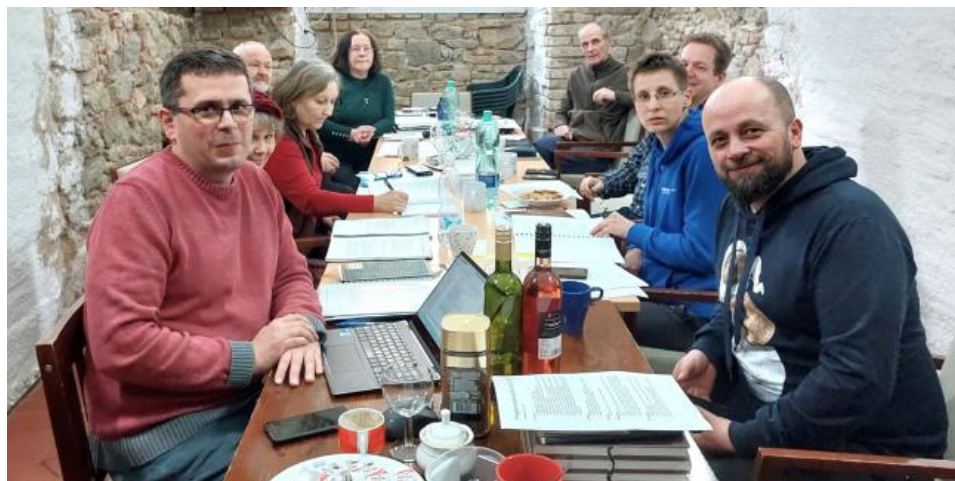
foto: stretnutie NR OFS