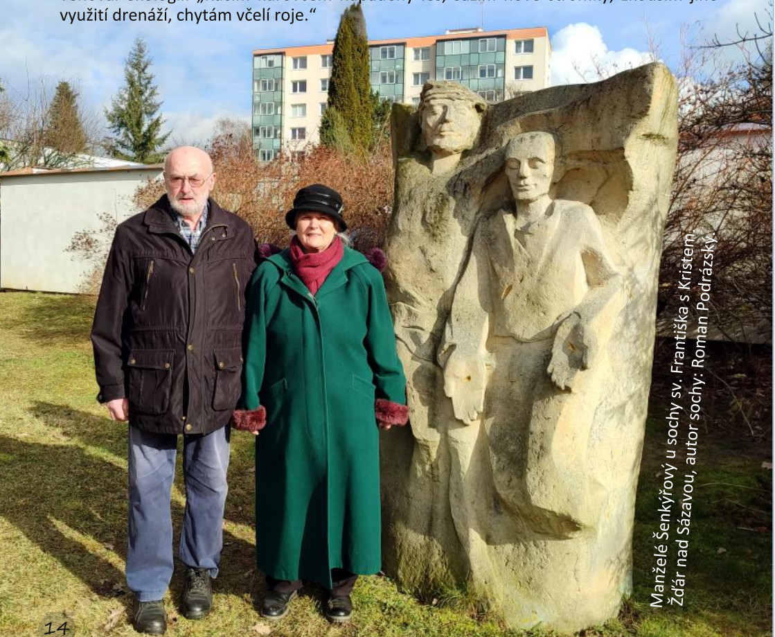
Manželé Šenkýřoví u sochy sv. Františka s Kristem Žďár nad Sázavou, autor sochy: Roman Podrázský.

Jeho manželka pracovala třicet let jako zubařka. Vytrvalou a obětavou starostí o domácnost a pět dětí, hojně pomáhala manželovi v jeho službě v politice i v církvi. Jiří vystudoval institut Jana Pavla II. a je činný v komisi biskupské konference. Velký zájem věnoval ekologii: „Kácím kůrovcem napadený les, sázím nové stromky, zkouším jiné využití drenáží, chytám včelí roje.“