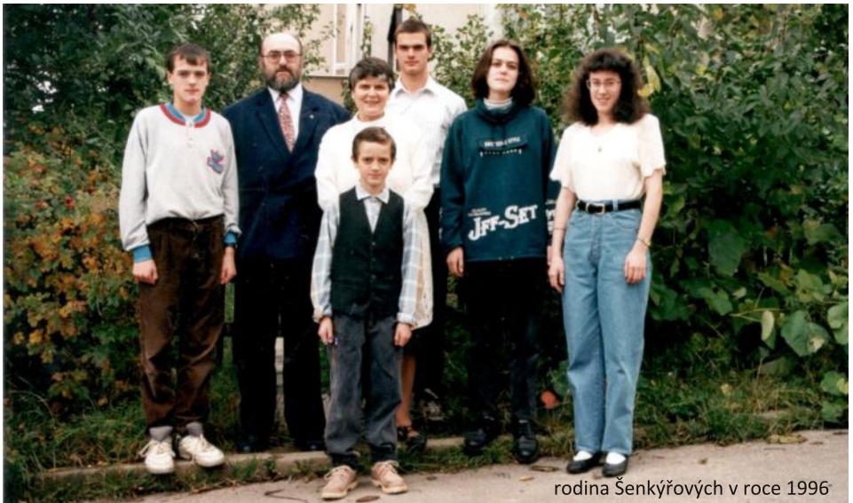
rodina Šenkýřových v roce 1996

redigoval Luboš Kolafa