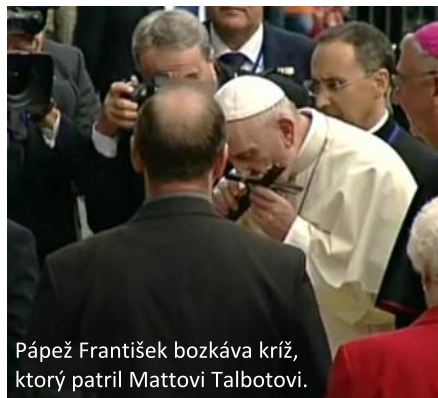
Pápež František bozkáva kríž, ktorý patrilo Mattovi Talbotovi.

V roku 1931 sa začal diecézny proces o hrdinských čnostiach Matta Talbota. Apoštolský proces, oficiálne skúmanie vo Vatikáne, sa začalo v roku 1947 a bolo úspešne ukončené v roku 1972. O tri roky neskôr bol Mattovi Talbotovi udelený titul ctihodný. Ak toto rozhodnutie potvrdia zázraky, vyžadované kánonickým právom, bude mocť nastať proces jeho blahorečenia. V roku 1972 boli jeho telesné pozostatky prenesené do kostola Panny Márie Lurdskej, na ulici Sean McDermott v Dubline.