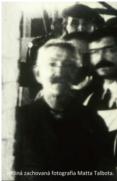
Jediná zachovaná fotografia Matta Talbota.