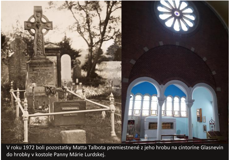
V roku 1972 boli pozostatky Matta Talbota premiestnené z jeho hrobu na cintoríne Glasnevin do hrobky v kostole Panny Márie Lurdskej.

https://www.katolsk.no/biografier/historisk/asalawa