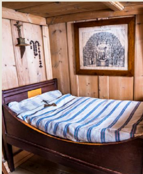
Izbička Marguerite Bays v La Pierraz

V živote svätej Marguerite Bays môžeme vidieť, čo znamená svätosť v kresťanskej viere. Nemá nič spoločné s hrdinstvom, senzáciou, ani so stigmami, ktoré sa pred zvedavcami snažila ukrývať. Nie je to vý-