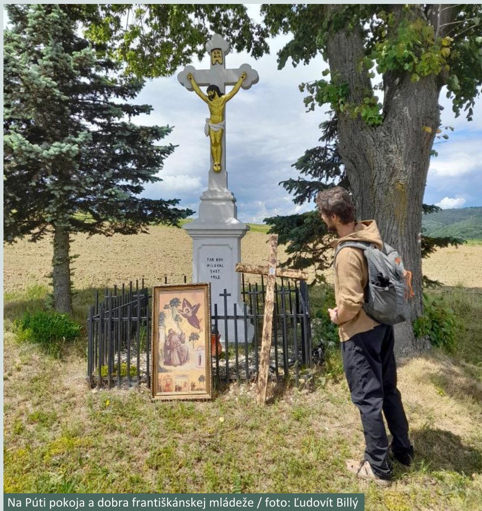
Na Púti pokoja a dobra františkánskej mládeže