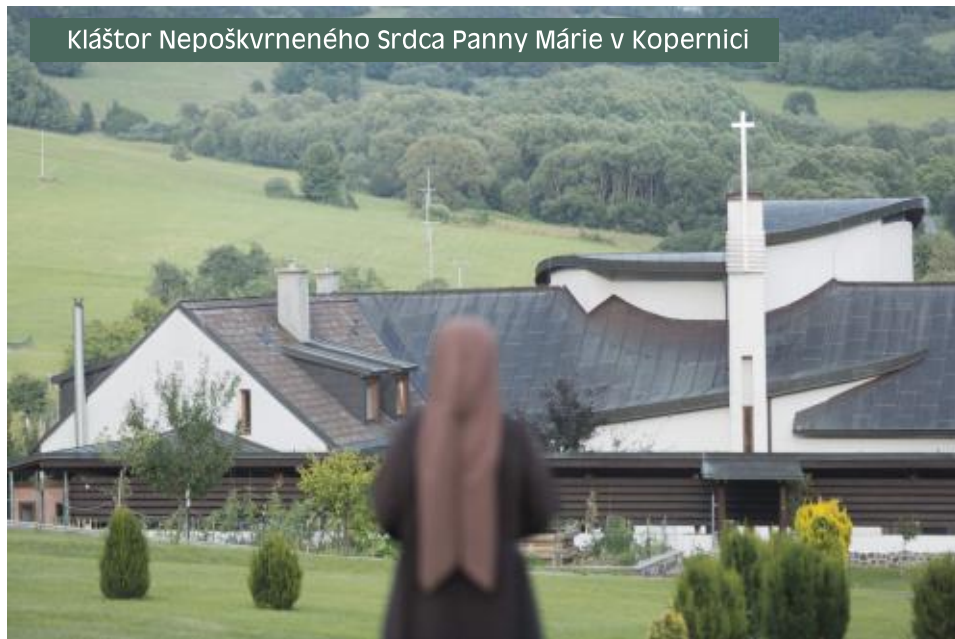
Kláštor Nepoškvrneného Srdca Panny Márie v Kopernici

https://kapucinky.kapucini.cz/subdom/kapucinky/index.php/cappucino-ufrantiska/blahoslavene/62-laurencielongo