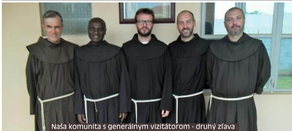
Naša komunita s generálnym vizitátorom - druhý zľava

minútach chôdze sme dorazili do chudobného, napoly rozpadnutého domu (ak sa to dá nazvať). Okolo sedelo zopár žien s deťmi. Ten muž mi hneď podal stoličku, aby som si najskôr sadol. Potom prišla jedna žena, ktorú poznám z nášho kostola a vošli sme do domu.