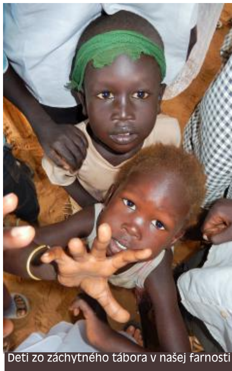
Deti zo záchranného tábora v našej farnosti

Ak by ste chceli podporiť hladujúce deti v Afrike, informácie nájdete na www.dobrotapreafriku.sk