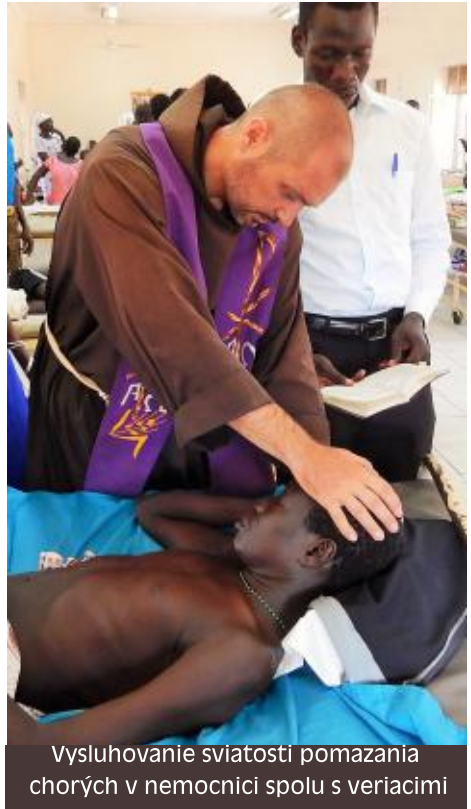
Vysluhovanie sviatosti pomazania chorých v nemocnici spolu s veriacimi

Som rektorom a správcom kostola, mám na starosti komunitu bratov ako gvardián, ktorú som prebral. Starám sa o bratský život, aby všetko bolo ako má byť, v Božej láske a podľa predpisov. Ako správca kostola mám na starosti liturgiu, údržbu a opravy budov, máme tu rodinné spoločenstvá, približne 30 párov s deťmi, ktorým sa venujem. V rámci nich je tzv. vnútorné spoločenstvo 12 párov, ktoré chcú intenzívnejšie prežívať svoju vieru, učím okolo 95 detí v tunajšej cirkevnej škôlke náboženstvo, je to 5 tried a pripadla mi služba štvrtročného spovedníka pre sestry Karmelitánky. A keď mám čas, venujem sa špeciálnej pastorácii, ktorá zahŕňa pomoc v osobných, manželských krízach, pomoc v duchovnom živote, pomáhám modlitbami za oslobodenia od zlého, proste čo som už robil, v rámci mojej kompetencie pomáhám čím môžem. Raz do mesiaca máme v kostole adoráciu pre rodiny, čomu sa veľmi teším, pretože prichádzajú aj rodičia s deťmi a tam v rámci adorácie máme aj požehňovanie a modlitbu príhovoru, tiež požehňovanie olejom sv. Šarbela, ktorého úctu šírim.