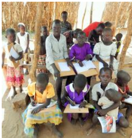
Vyučovanie detí a žien v Amady