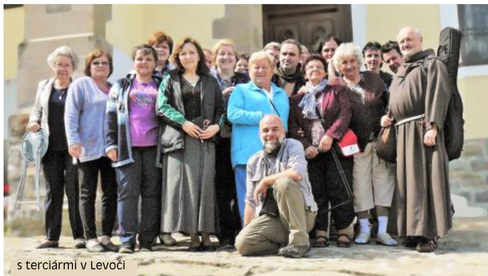
s terciármi v Levoči