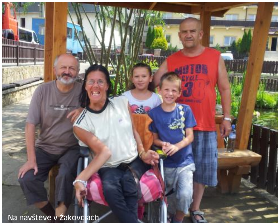
Na návšteve v Žakovciach

(okrem detvianskych terciárov, kde som to nedokázal zladit' s mojimi povinnosťami učiteľa a katechéty), mával som s nimi i duchovné cvičenia, prípadne duchovné obnovy. Terciár, ak chce napredovať v šľapajach sv. Františka, mal by čerpať z prameňov; t.j. z ducha svojho Zakladateľa. K jeho poznaniu napomáha Regula a určite počiatočná formácia, ku ktorej by sa terciár mal raz za čas vracat' a osviežovat' si cenné myšlienky v nej prítomné. A nepochybne časté rozjímanie Svätého písma, hlavne evanjelia, lebo to bolo zdrojom a inšpiráciou života sv. Františka.