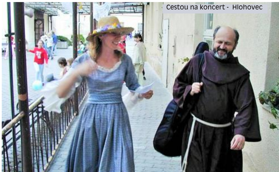
Cestou na koncert - Hlohovec

Ako som už v doteraz povedanom naznačil, modlitba nie je len o vyhľadávaní „tichých chvíľ osamote“, kde by sa človek stretol so svojím Pánom a Bohom. Iste, aj to je potrebné, ved' nás k tomu vyzýva samotný Ježiš (Mt 6, 6). Ale to by nestačilo. O našom Zakladateľovi je napísané, že on sa už nielen modlil, ale „on sa stal modlitbou“. Všetko má totiž podľa neho slúžiť duchu modlitby. Ale musím priznať že ma bolí, keď si nenachádzam čas na spomínané intímne chvíle s Kristom byť osamote.