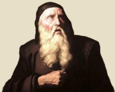
Bl. Rajmund Lullus

Aj prostredníctvom cechov sa františkáni snažili priviesť ostatných k láske k práci, počestnosti v obchodovaní, o dobré mravy a zásady vzájomnej pomoci. Pochádzali z najrôznejších vrstiev. Ovocím tretieho rádu už v 13. storočí, ako uvádzajú najstaršie pramene, bolo až 14 svätorečených terciárov. Patrónka tretieho rádu v Durínsku - sv. Alžbeta Uhorská (1207 – 1231) posvätila františkánskymi cnosťami manželstvo, materstvo, vdovstvo, trón aj vyhnanstvo, šťastie v láske i trápenie z prenasledovania. V Španielsku to boli sv. Ferdinand Kastílsky (1201-1252), panovník, muž hlbokkej viery, veľký ctiteľ Panny Márie, vo Francúzsku sv. Ivona a sv. Ľudovít IX. (1214-1270), patrón 3. rádu, obranca Cirkvi, ktorý sa preslávil modlitbou a duchom pokánia. V Taliansku je prvých svätých terciárov viaceru: blahoslavený Lucchesio a Bonadonna, prví terciári, svätá Ružena z Viterba (1233-1252), jednoduché dievča obdarené mystickými