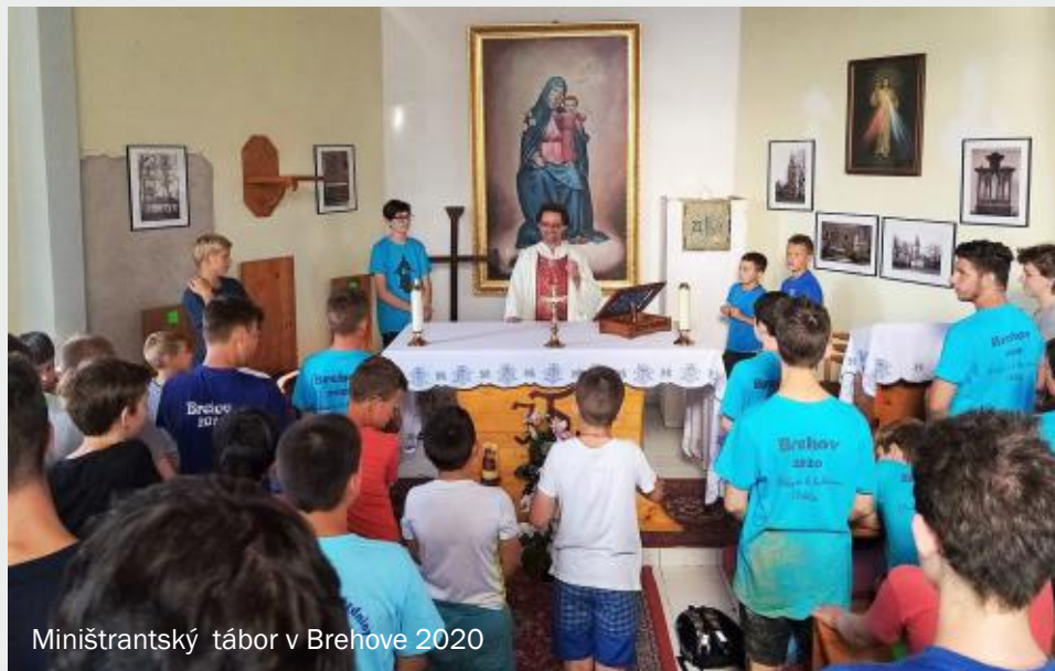
Miništrantský tábor v Brehove 2020

V Zbierke z Assisi čítame: „Raz sa istý brat opýtal sv. Františka z Assisi: „Brat [František], prečo svojmu spoločníkovi nekážeš, aby ti čítal nejaký úryvok z Písíem Prorokov a iných Písíem, vďaka čomu sa tvoj duch bude radowať v Pánovi a okúsi najväčšiu útechu?“ – Sv. František odpovedal: „Brat môj, každý deň poznávam takú sladkosť a potešenie z rozjímania znakov pokory Božieho Syna v mojej pamäti, že by som mohol žiť až do konca sveta a nebolo by mi veľmi potrebné rozjímanie alebo čítanie iných Písíem.“