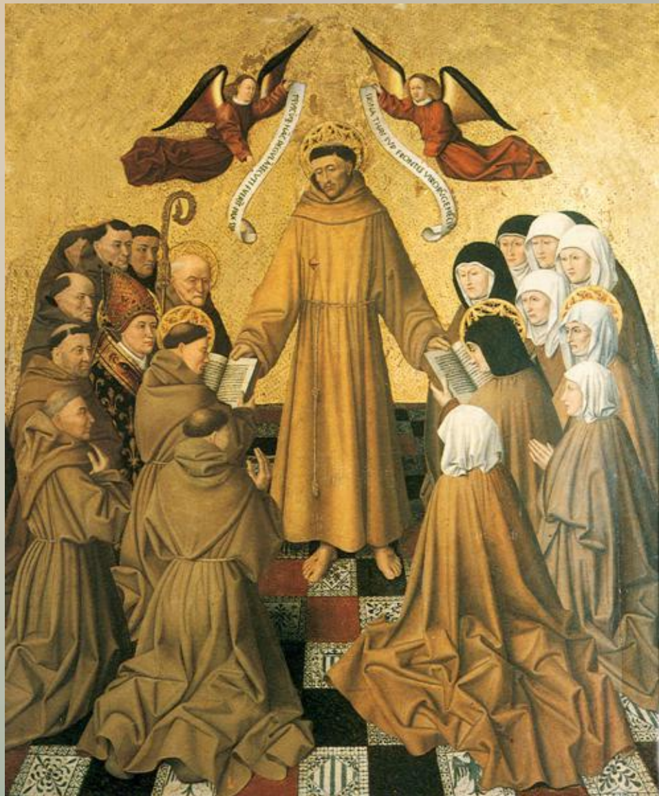
Svätý František odovzdáva regulu (Niccolò Antonio Colantonio r. 1445)

Sv. František sám nemal túžbu po čítaní kníh, jeho učebnicami boli Ukrižova-