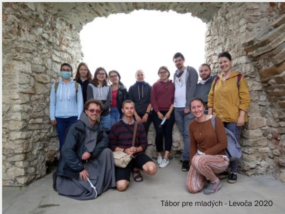
Tábor pre mladých - Levoča 2020