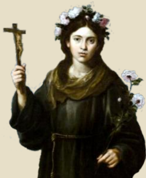
Sv. Ružena z Viterba