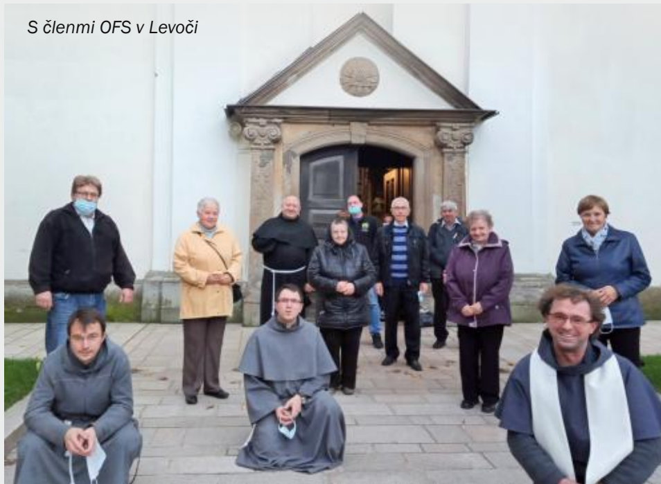
S členmi OFS v Levoči

vnucovať, aby sa niekto stretával častejšie, no bolo by, podľa mňa, užitočné trochu viac naliehať na prvý rád, aby sa častejšie venoval tým, čo majú záujem. Som presvedčený, že z takých stretnutí by sa zrodili aj rôzne iniciatívy.