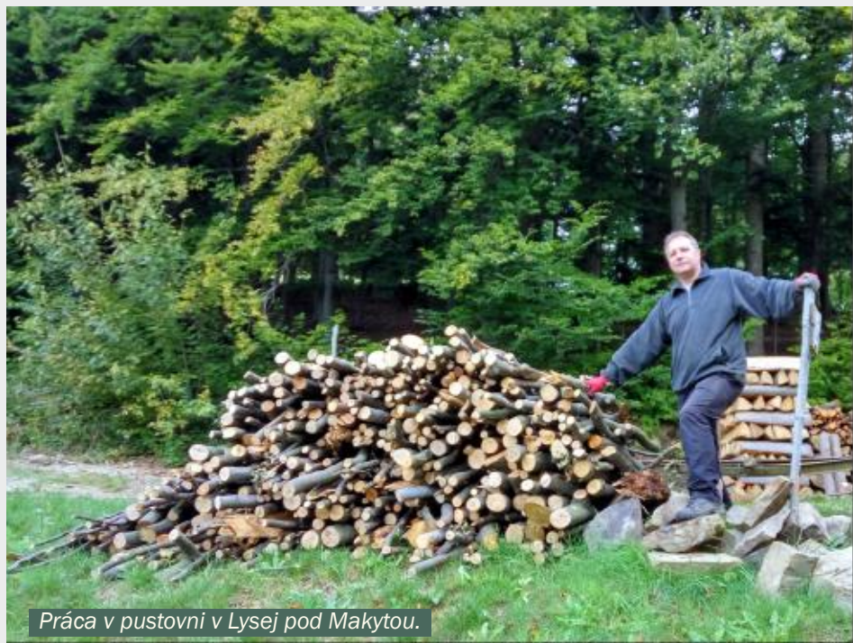
Práca v pustovni v Lysej pod Makytou.