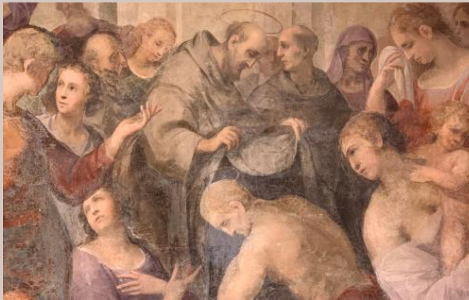
Svätý František prijíma Lucchesia a jeho manželku Bonadonnu do tretieho rádu.

Keď František videl, že príklad prvých terciárov, Lucchesia a jeho manželky Bonadonny priťahuje mnohých a počet prvých členov, nielen v meste Poggi Bonzi, ale aj v celom kraji zo dňa na deň narastal, zvolal ich do malej skromnej kaplnky, ktorú im daroval istý občan zo Sieny a tam, tiež často aj pod otvoreným nebom, mával s nimi rozličné pobožnosti. Dôkladne ich poučoval ako majú zachovávať regulu a podľa nej si zariadiť svoj život. Nakoniec, keď videl ich nadšenie a že sú s novým stavom spriatelení, menoval predstaveného rádu, aby ich pod dohľadom toskánskeho provinciála spravoval. Potom sa sám na jeseň pobral na juh smerom k Viterbo, majúc namierené do Ríma, ktorý ho mocne priťahoval. Po ceste neustále ohlasoval slovo Božie a ďalej získaval nemálo nových členov všetkých rádov. Taká veľká bola sila Pánovho Ducha v ňom.