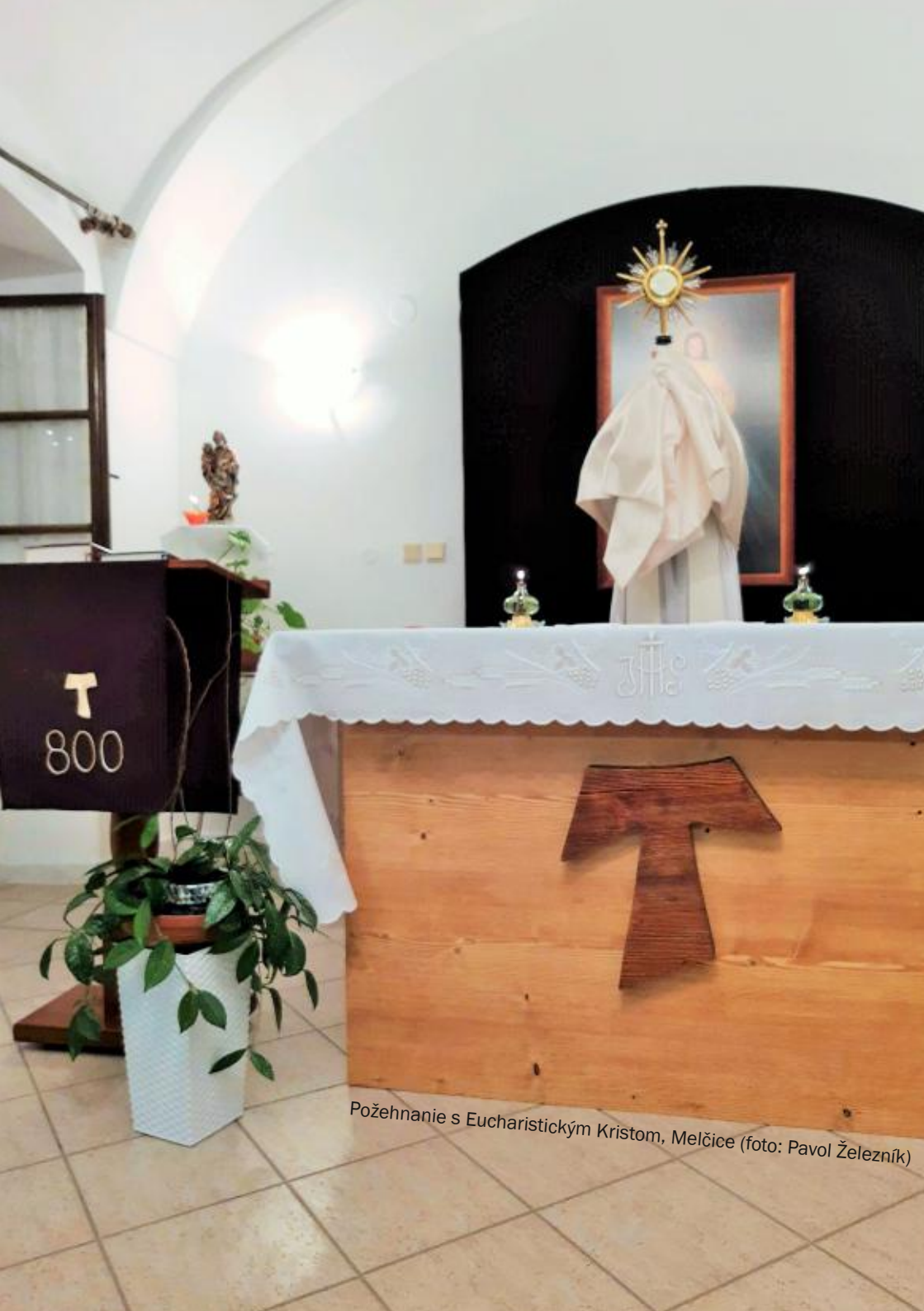
Požehnanie s Eucharistickým Kristom, Melčice