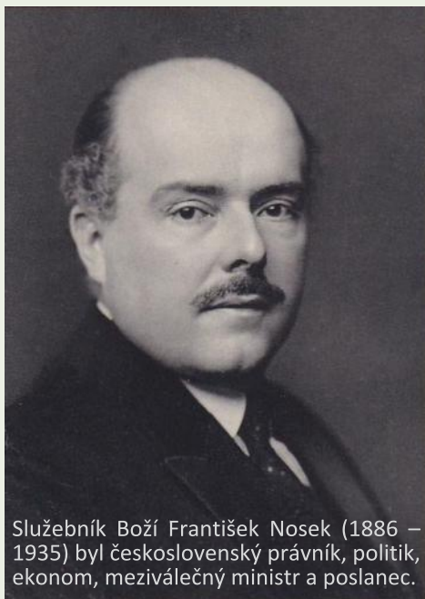
Služebník Boží František Nosek (1886 – 1935) byl československý právník, politik, ekonom, meziválečný ministr a poslanec.

Jako patrony v SFŘ máme svatého krále Ludvíka a svatou šlechtičnu Alžbětu; za těch 8 století od života sv.Františka i v celé františkánské rodině většina z těch více než pěti set kanonizovaných bratří a sester žila ve společenském uspořádání nám už velice vzdáleném. To ovšem neubírá nic na svatosti jejich života jako příkladu pro nás. Bratr František Nosek však již žil v době velice blízké té naší: podílel se sice rovněž na moci politické, ale v republice a parlamentní demokracii, a moci hospodářské, ale za převažující vlády zhodnocování kapitálu. A tak příklad jeho růstu víry v přecházení od evangelia k životu a od života